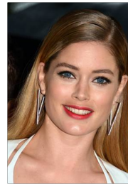
Doutzen Kroes in Cannes