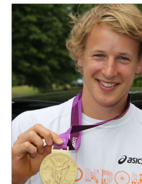
Epke Zonderland met Olympisch goud.