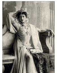
Mata Hari CC0

AFBEELDING: HTTPS://COMMONS.WIKIMEDIA.ORG/WIKI/USER:TUBS CC: BY-SA 3.0